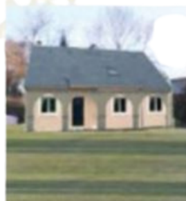
vue terrain - APRES