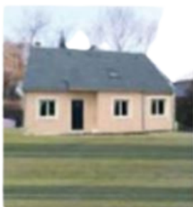
vue terrain AVANT

Ce document permet d'apprécier la réalisation du projet de modification de façade.